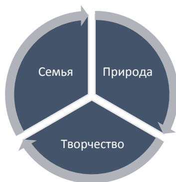
Рис. 2 – Направления патриотического воспитания

Воспитание будущего патриота нужно начинать с ближайшего для него окружения: семьи, родного дома, улицы, малой Родины. Патриотическое воспитание целесообразно осуществлять по следующим направлениям (Рисунок 2):